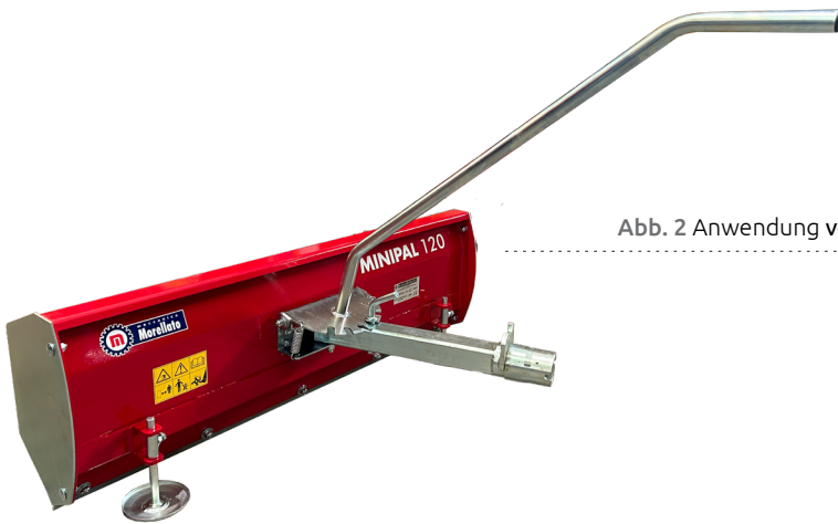
Abb. 2 Anwendung von Einstellhebel und seitenwände

Manuell einstellbare Neigung Angeschraubte Schiebeklinge