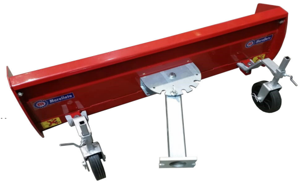
Abb. 3 Anbau Stützräder