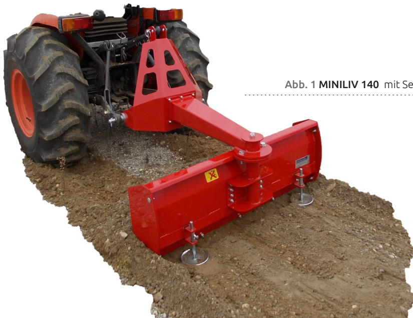
Abb. 1 MINILIV 140 mit Seitenwänden, anwendung auf Minitraktor